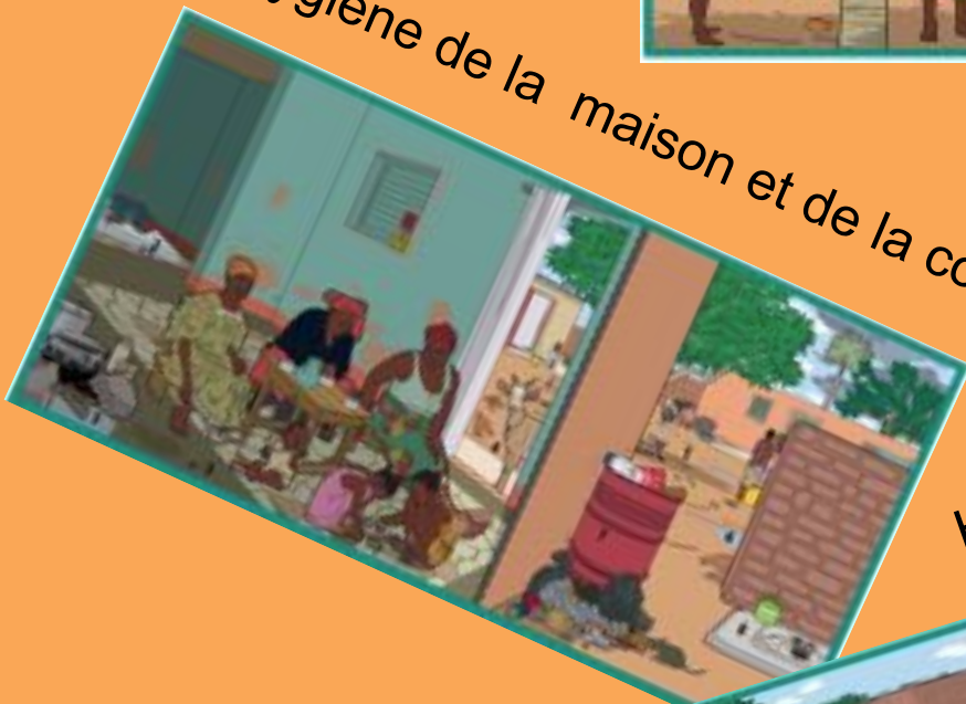
Hygiène de la maison et de la cour