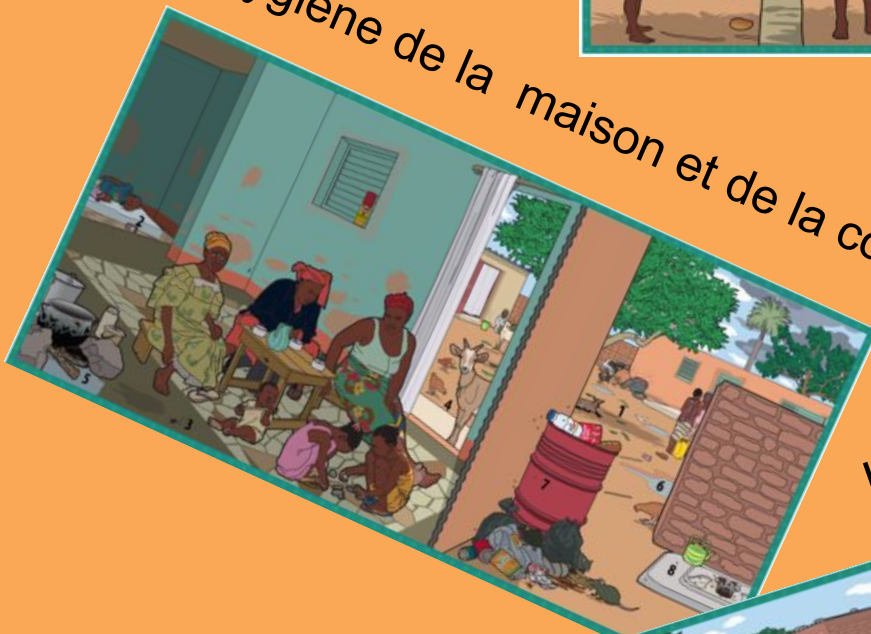
Hygiène de la maison et de la cour